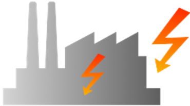
Bedrohung von Innen und Außen

Haben Sie alles getan, damit Ihre Informationen immer verfügbar und aktuell sind, nicht manipuliert werden, nicht verloren gehen oder in falsche Hände geraten?